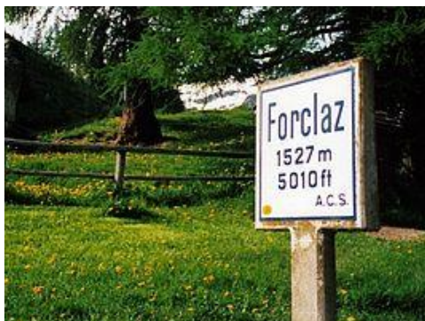
Chalet La Promenade

Rte de Bréona 1, 1985 La Forclaz – Zwitserland